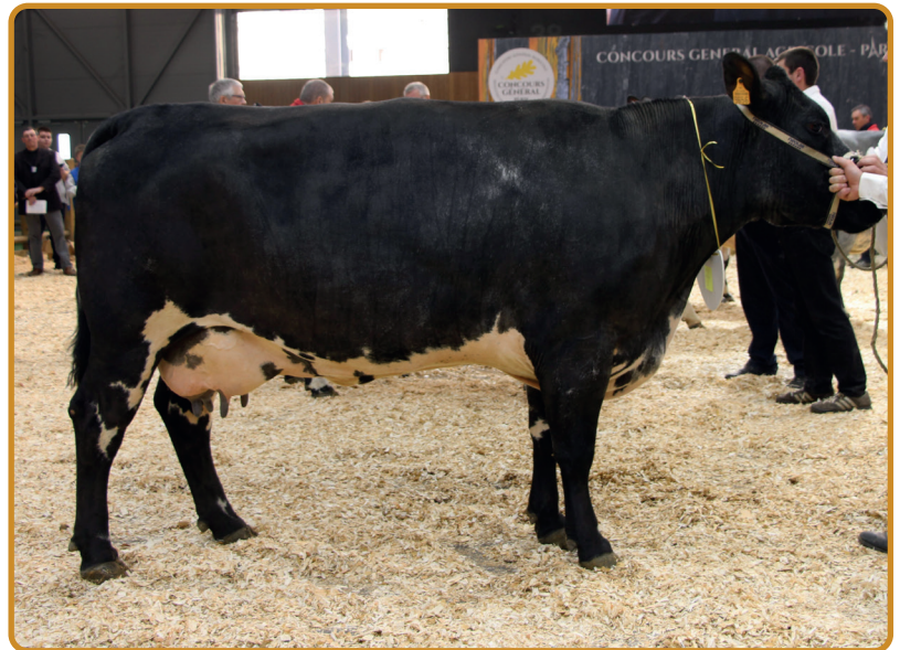
HÉROÏNE, mère de Milou