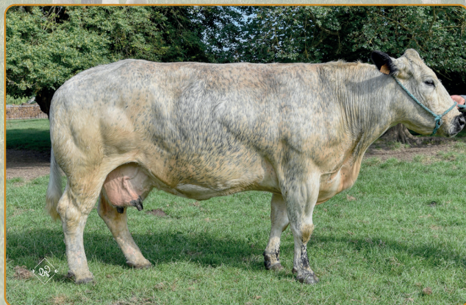
FAUSTINE du Clypot, mère à taureau