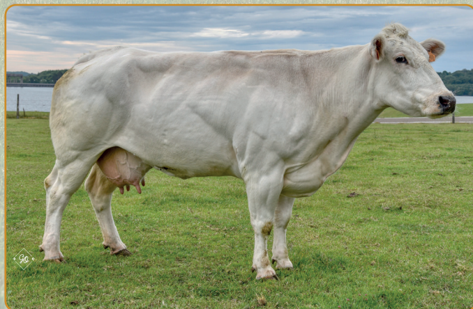
BINETTE de la Platte Taille, mère à taureau