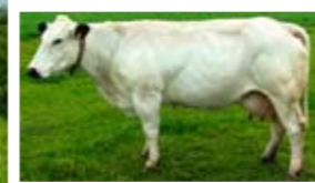
(Mh/Mh) FRÉDÉRIQUE, MÈRE DE CASIMIR