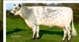
(Mh/+) VICTORIA, MÈRE À TAUREAUX